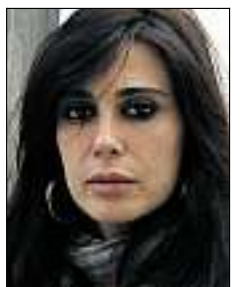
Regissør Nadine Labaki fikk publikumsprisen.

Festivalens hovedpris gikk til roadmovien Las Acacias fra Argentina. Juryen beskriver det som Hovedkonkurransens «kanskje enkleste film – men også den som har berørt dypest». Thrilleren On the edge ble tildelt den internasjonale filmkritikerprisen FIPRESCI, mens publikumsprisen gikk til Where do we go now? – regissert av libanesiske Nadine Labaki som selv deltok på årets Film fra Sør.