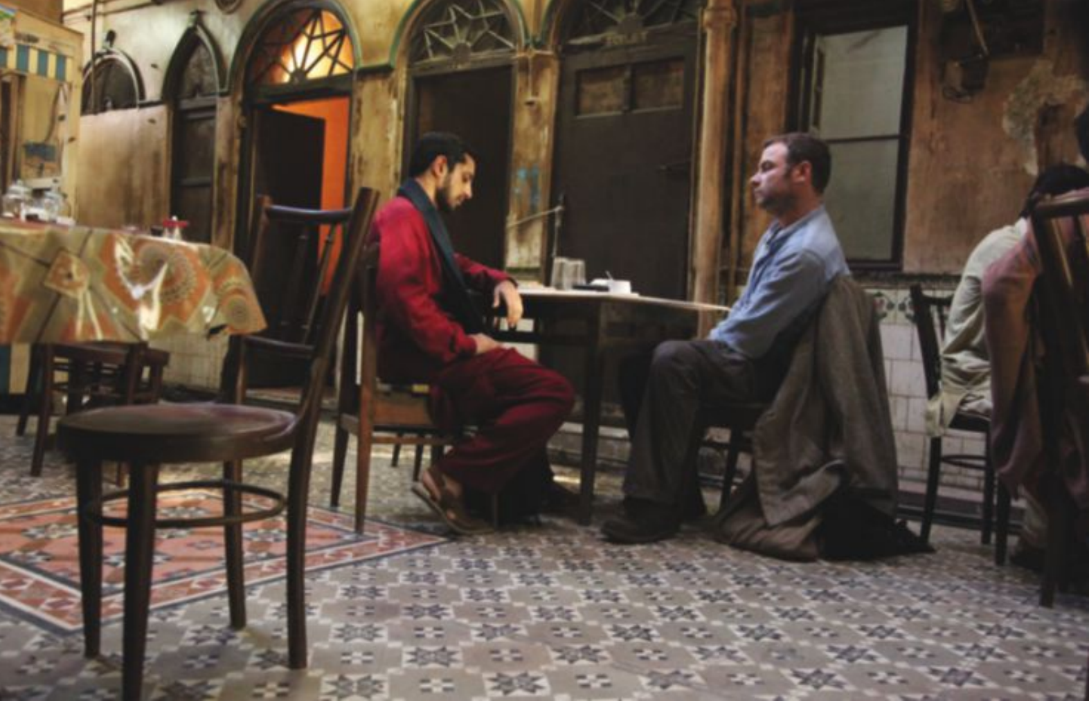
DIALOG: Filmen om Den motvillige fundamentalist har sine paralleller til XXY fra 2007.

som litt for raskt når til topps på Wall Street, for så å vende tilbake til sine røtter. Hovedpersonen – Changez – er nemlig en pakistaner som ved hjelp av hardt arbeid og talent oppnår alt han har drømt om i New Yorks finansverden, men som trer inn i en identitetskrise idet han føler et stikk av noe ubestemmelig – er det glede? – i det han får se tvillingtårnene rase sammen på TV den 11. september 2001.