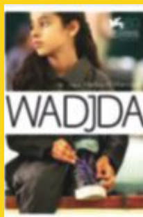
WADJDA Regissør: Haifa Al-Mansour Saudi-Arabia, 2012