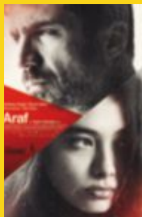
ARAF Regissør: Yesim Ustaoglu Tyrkia, 2012