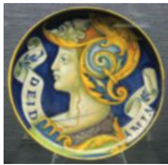
Deidamia framstilt på eit fat av Nicolò da Urbino frå 1525.