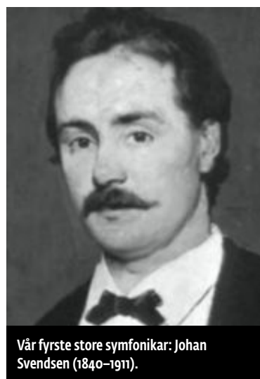
Vår fyrste store symfonikar: Johan Svendsen (1840–1911).