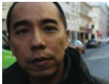
Apichatpong Weerasethakul frå Thailand fekk ærespris av Film frå Sør.

utstillinga skildrar eg også forfølgjingar i nyare tid mot opposisjonelle, seier han.